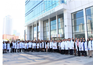
Eczacılık Fakültesi Öğrencilerimiz Beyaz Önlüklerini Giydi