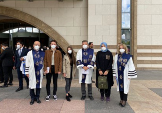
2021-2022 Akademik Yılı Yükseköğretim Yılı Açılış Töreni'ne Katıldık