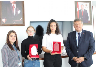
Rektörümüz Milli Sporcu Öğrenciler ile Bir Araya Geldi