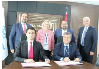
LHÜ ve TRPHARM Arasında İş Birliği Protokolü İmzalandı