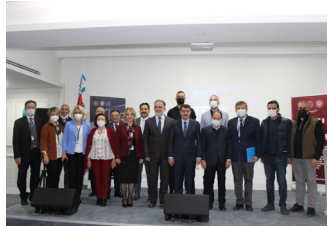
Tek Pota Lise Projesi Hayata Geçirildi